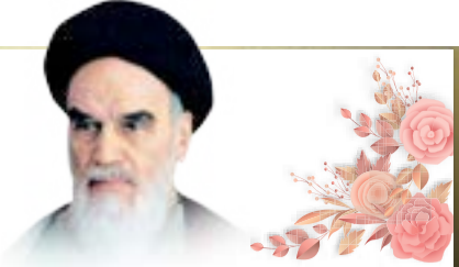
استاد امام خمینی (ره) در مدح حضرت نهدی (عج)