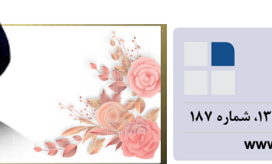
اشتهار امام خمینی (ره) در مدح حضرت مهدی (عج)

یک نکته‌ی دیگر این است که ببینید یک وقت قضیه‌ی مسجد گوهرشاد را از نگاه یک فاجعه‌ی تاریخی که اتفاق افتاده نگاه می‌کنید؛ آن همین است دیگر، همین است که تصویرهایش این جور کشیده می‌شود؛ یعنی بعد مردم مؤمن برای خاطر مقصودی در یک جای مقدسی جمع شدند، مأمورین دولتی ریختند اینها را کشند. البته کشتار فقط در مسجدهم نبوده، بلکه بیرون، در فلکه -آن فلکه‌ای قدیم که البته حالا دیگر نیست- بست پایین خیابان، جلوی آن باصلطح خیابان تهران، یعنی خیابان امام رضا (علیه‌السلام) اینجا همه آدم کشته شده. همین در جنوبی مسجد گوهرشاد که الان آن در جنوبی بسته است و در محلت صحن قدس را درست کرده‌اند، آنجا به عوض صحن قدس یک راهرویی بود که منی آمد در مسجد گوهرشاد و در همان راهرو عده‌ی زیادی نشستند که قضایایش را من نمی‌دانم کجا خواندم و الان واقعا یاد نمی‌کنم که این را خواندم اما معلّم که همانجا عده‌ای را کشتند. کسانی می‌گویند ما از بالاخانه نگاه میکردیم و می‌دیدیم که مردم را می‌کشند و نیمه‌جان سوار کامیون می‌کنند و می‌برند و در منطقه‌ی علم‌دشت هم دفن می‌کنند؛ همان حرف‌هایی که معروف است، پتی بنابراین یک نگاه، این نگاه است؛ نگاه یک فاجعه‌ای که در مشهد به مناسبت حجاب اتفاق افتاده.