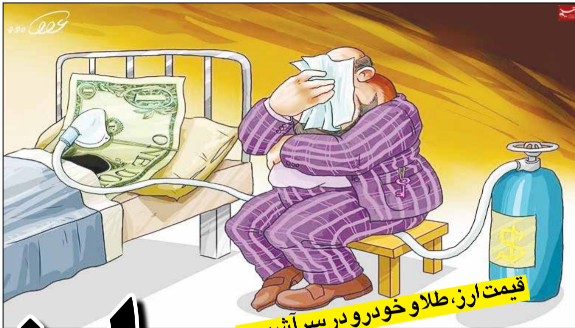
قیمت ارز، طلا و خودرو در سر آشیبایی