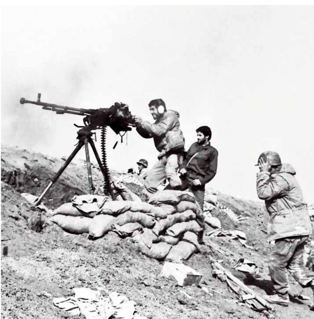
عکس نوشت ۵ مرداد ماه ۱۳۹۷ سالروز عملیات مرصاد گرامی یاد