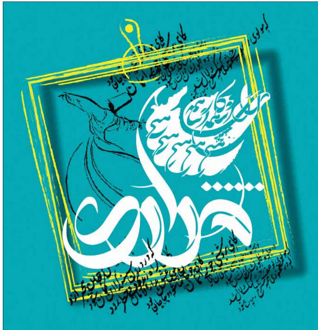
عکس نوشت | هشتم مهرماه روز بزرگداشت مولانا گرامی باد

وی گفت: همچنین قیمت تمام‌شده پول، با مسکن مهر از ۱۳،۵۶ به ۱۳،۴۴ درصد و بدون مسکن مهر از ۲۰ به ۱۸،۹ درصد کاهش یافته است.