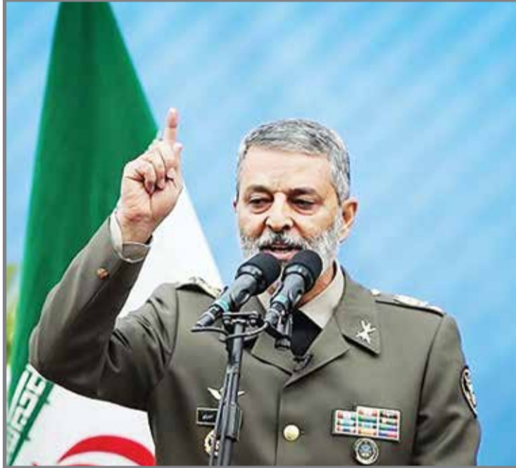
امیر سر لشکر سید عبدالرحیم موسوی در سخنرانی یوم‌الله ۱۳ آبان: