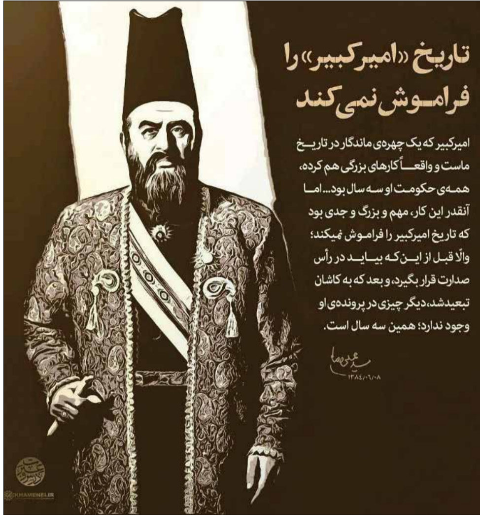
شهادت میرزا محمد تقی خان فراهانی (امیرکبیر) گرامی باد