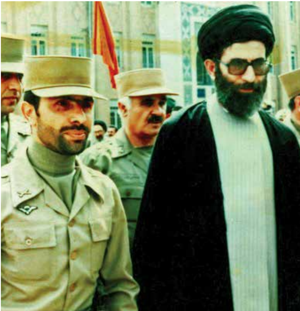
عکس نوشت امیر سید شهید علی صیاد شیرازی در کنار حضرت آیت‌الله خامنه‌ای

شنبه ۲۳ فروردین ماه ۱۳۹۹ | شماره ۲۲۲ (پیاپی ۳۱۳) | ۸ صفحه | ۲۰۰۰ تومان