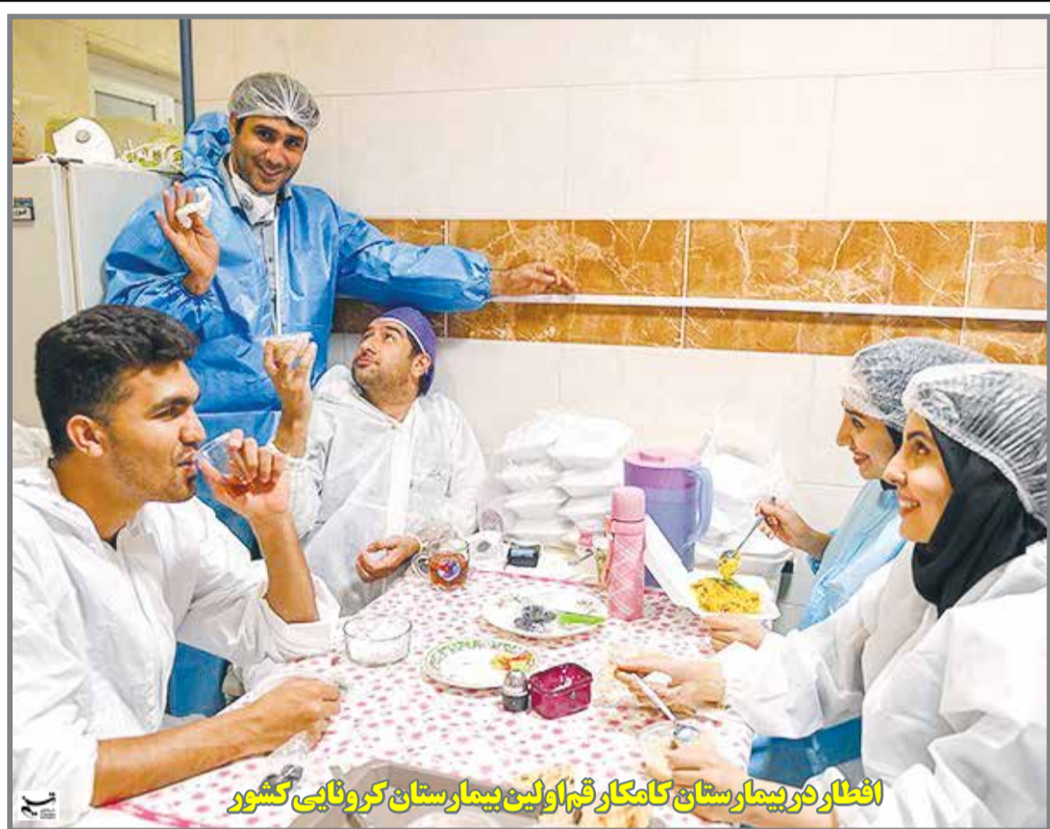
افطار در بیمارستان کامکار قم اولین بیمارستان کرونایی کشور

در شرایطی که جهان درگیر ویروس کووید ۱۹ است آیا نمی خواهیم برنامہ ریزی دقیق و عملیاتی به فکر پسا کرونا باشیم. حضرت علی (ع) میفرماید: گناه نکردن بهتر از توبه کردن است، آیا بیمار نشدن بهتر از مداوا یا فوت نیست؟! چه بهتر که بتوانیم با اقدامات معقول از اجتماعات، مراکز پر تردد دوری و در محل امن منزل، برنامه هایمان را دنبال کنیم و امیدواریم دولت مردانمان به فکر ساماندهی شرایط مطلوب برای قشر محروم و ضعیفی که حقوق بگیر دولتی نیستند باشند. با توجه به اینکه روابط عمومی ها، قلب مراکز ارتباطات ارباب رجوع و مدیران است، اما بعد از چهل و اندی سال از پیروزی انقلاب اسلامی، آیا این مراکز ارتباطی توانسته به وظایف حساس خود جامه عمل بپوشاند، خصوصاً ایام پسا کرونا، چون کانال ارتباطی مدیرانند؟! و در این چند ساله که از تأسیس گروه و صفحہ تخصصی بانک، بورس و بیمه و ... در نشریه می گذرد، در عمل برای برقراری ارتباطی با مدیران و گزارشگران بانک ها و بیمه ها به منظور دریافت و انعکاس دیدگاه های شان درباره مسائل مربوط به این دو حوزه با موانع و دشواری هایی مواجه شده ایم. ادامه صفحه ۸