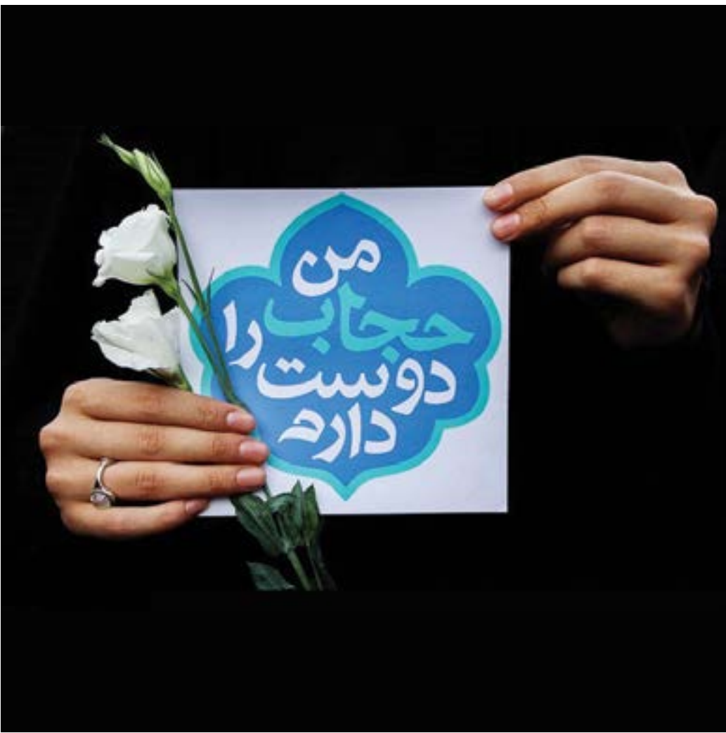
عکس نوشت: روز عفاف و حجاب بر تمام مسلمانان جهان مبارک باد

ایشان اظهار داشت: "هیات حسابرسی ویژه نحوه برگشت ارز حاصل از صادرات این شرکت‌ها" به‌تازگی تشکیل شده است و هنوز گزارشی خروجی برای ارائه ندارد. دیده‌گفته رئیس دیوان محاسبات کشور اکثر شرکت‌هایی که برگشت ارز حاصل از صادرات آن‌ها دچار مشکل شده است خصوصی هستند و این مهم حتی شامل شرکت‌های پتروشیمی نیز می‌شود.