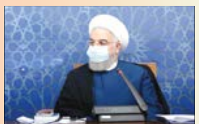
تمامی دستگاه های دولتی طبق ضوابط و مقررات اعلام شده، موظف به عرضه سهام شرکت های خود در بورس هستند/ هیجان زدگی کاذب نباید بورس را متاثر کند/ ارشد شاخص های بورس

باید طبق پایه های علمی دقیق و بر اساس منطق بازار سرمایه پیش برود/ دولت برای صادر کنندگانی که در موعد مقرر به تعهدات ارزی خود عمل کرده اند، مشوق و امتیازات ویژه در نظر می گیرد رئیس جمهور در جلسه ستاد اقتصادی دولت، مدیریت بازار سرمایه و افزایش عرضه های اولیه را اقدامی اصولی و دقیق جهت ایجاد ثبات، توسعه و رونق بخشی به بازارهای مالی و اقتصاد کشور دانست. صادر کنندگانی که از عرضه ارز حاصل از صادرات در موعد مقرر خودداری کرده اند، تحت پیگرد قرار می گیرند مدیریت بازار سرمایه و افزایش عرضه های اولیه اقدامی اصولی جهت ایجاد ثبات، توسعه و رونق بخشی به بازارهای مالی و اقتصاد است حجت الاسلام والمسلمین دکتر حسن روحانی با بیان اینکه