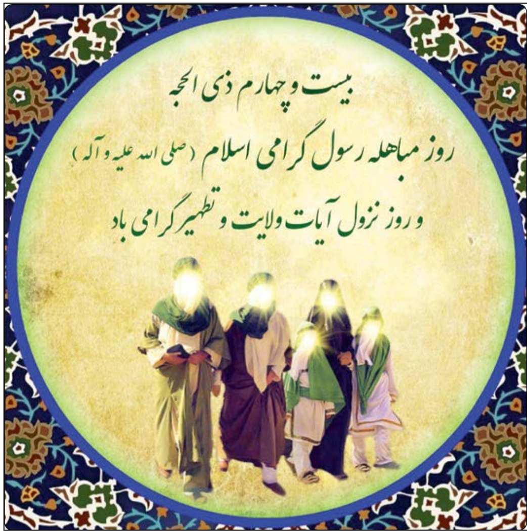
عکس نوشت آیه ماهله، آیه ۶۱ سوره آل عمران است که پیرامون مناظره‌های بین محمد (ص) پیامبر اسلام و هیأت تجرانی نازل شده است.