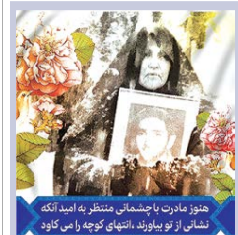
هنوز مادرت با چشمانی منتظر به امید آنکه نشانی از تو بیاورد، انتهای کوچکی را می‌کاود