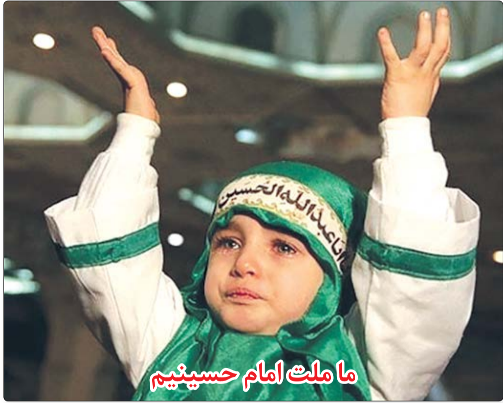
ما ملت امام حسینیم