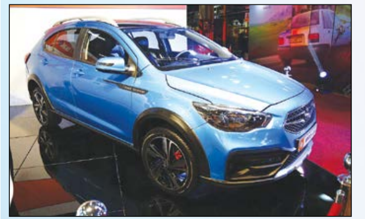
قوای محرکه مختلف

همچنین پروژه نمونه اتوماتیک SP100 کراس هم در دست انجام است و در آینده نزدیک علاقه‌مندان به این کراس اور می‌توانند تا به جای استفاده از جعبه دنده ۵ سرعته در خودرو، از جعبه دنده ۶ سرعته اتوماتیک بهره‌مند شوند.