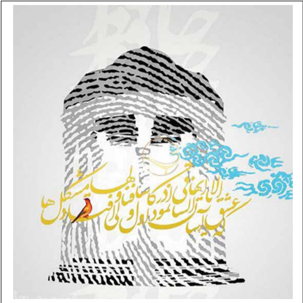
عکس نوشت ۲۰ مهر روز بزرگداشت حافظ گرامی باد