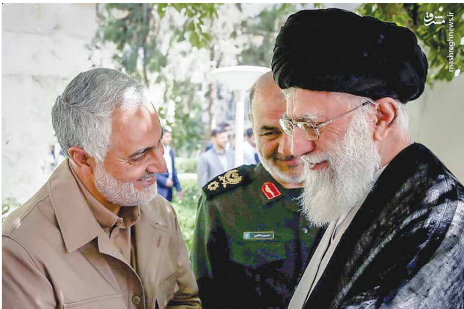
مشارکت‌های خبری از قاجاقچی

سردار سپهبد پاسدار شهید حاج قاسم سلیمانی، با خون خویش در آسمان عزت ملی ستاره‌نشانند. یکسال از شهادت فرمانده شهید، پاسدار اسلام، سردار دلها و دگر یارانش گذشت، نگاهی به بیانات رهبر معظم انقلاب اسلامی که فرموده: «ما فعلاً اولین سیلی انتقام‌سخت، موشک‌های سپاه پاسداران انقلاب اسلامی به دو پایگاه امریکایی جنایتکار در عراق فرود آمد، جای تشکر ویژه و خدقوت دارد، مقاومت جهاد اسلامی و جهان منتظر انتقام سخت از خائنان است. آری، شهید حاج قاسم با خون تازه‌های خویش سرود سرخ شهادت را در تاریخ جهان تئین انداخت. تا بدین سان سرشک تاریخ بر صفحه روزگار فرود چکند. او حماسه‌ای بوده به وسعت تاریخ و ژرفای عشق و آفرینش؟ نام بلند آوازه حاج قاسم، جهانگیر شده و نماد راستین مقاومت ملی اشتها یافت. در روزگار تاری، که