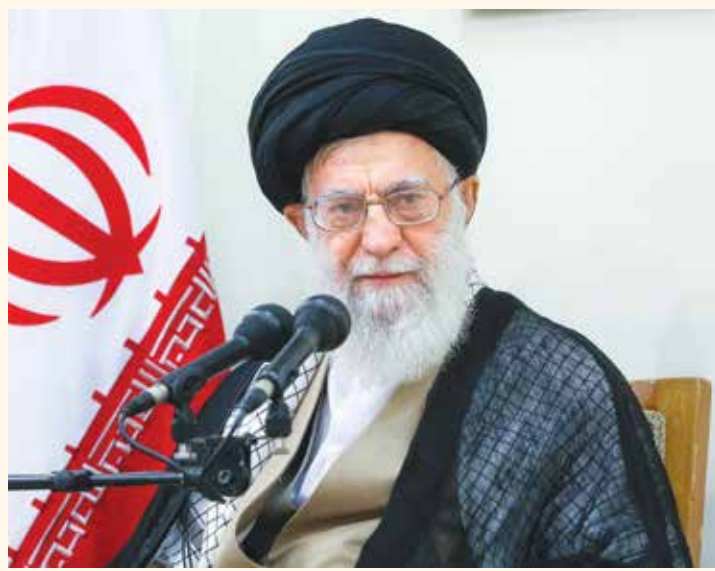
رهبر معظم انقلاب اسلامی: