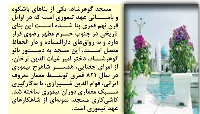
مسجد گوهرشاد، یکی از بناهای باشکوه و باستانی عهد تیموری است که در اوایل قرن نهم قمری بنا شده است. این بنا تاریخی در جنوب حرم مطهر رضوی قرار دارد و به رواق‌های دارالسیاده و دار الحفظ متصل است. این مسجد به دستنور بانو گوهرشاد، دختر امیر غیاث‌الدین ترخان، از امرای جغتایی، همسر شاهرخ تیموری در سال ۸۲۱ قمری توسط معمار معروف ایرانی، قوام‌الدین شیرازی، با به کارگیری سبک معماری دوران تیموری ساخته شد. کاشی‌کاری مسجد، نمونه‌ای از شاهکارهای عهد تیموری است.