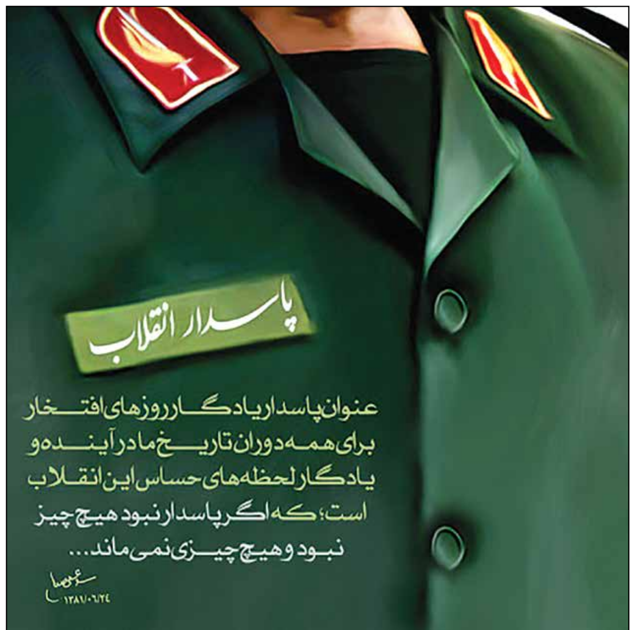
عکس نوشت: دوم شعبان روز پاسدار بر همه پاسداران اسلام گرامی باد

وی افزود: ایجاد اختلال در گسترش توان دفاعی ایران اسلامی با هدف تضعیف روند قدرت‌افزایی و عزت‌افزینی و ایجاد تهازل و وسیع قدرت و حذف نفوذ گفتنی‌های ایران انقلابی در منطقه و نیز خنثی‌سازی این قدرت نافذ در میدان ذهن و قلب ملت‌های مسلمان از دیگر راهبردهای دشمن برابر نظام مقدس جمهوری اسلامی است. وی با تأکید بر اینکه ملت ایران، دشمن را در اعمال فشار و تحریم خسته کرده‌اند، گفت: وقتی کشوری از رهبری حکیم، شجاع، عمیق و ژرف‌اندیش ملتی فهیم، آگاه و معتمد به رهبر و نیروهای مسلحی قدرت یافته در متن جدال با دشمن بر خوردار است، آسیب و گزند نمی‌بیند و این اصل و ریشه نگاه ما به صحنه تقابل راهبردی با امریکا و متحدان او است. سرلشکر سلامی با تقدیر از تلاشگران عرصه ارتقای توان دفاعی و با تأکید بر اینکه تا آخر ایستاده‌ایم و صحنه را ترک نمی‌کنیم تا پشت دشمنان را به خاک برسانیم، گفت: رونمایی و الحاق این دستاوردهای امیدآفرین و اطمینان‌بخش و برداشتن گام‌های بلند در راستای بی‌شمارسازی سامانه‌های موشکی نیروی دریایی سپاه با قابلیت‌های متنوع، نشان از عزم و اراده راسخ مادر دفاع از منافع، مصالح و کرامت ملت عزیز و بزرگوار ایران دارد.