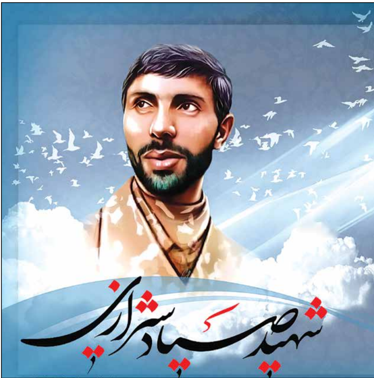
۲۱ فروردین سالروز شهادت امیر سپهبد علی صیاد شیرازی تسلیت باد