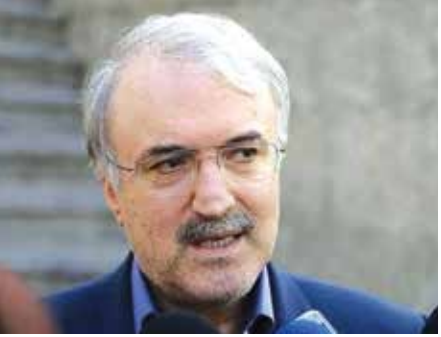
موازین بهداشتی و بر اساس ضوابط مشخص و علمی، مشکلی ایجاد نخواهد کرد.

قرمز کرونایی نیز اقدام کرد. وی اظهار داشت: در زمینه برگزاری آیین‌های عبادی و مذهبی ما مبارک رمضان در مناطق قرمز کرونایی مکتوباتی می‌کشاکش ایجاد شده و وزارت بهداشت با اجرای آیین‌های عبادی ماه مبارک رمضان منوط به اجرای دقیق پروتکل‌ها و مصوبات ستاد ملی مقابله با کرونا، مخالفتی ندارد. «سعید نمکی» روز پنجشنبه در دیدار با نماینده ولی‌فقیه در استان و امام‌جمعه همدان، تأکید کرد که با اجرای دقیق پروتکل‌های بهداشتی و مصوبات ستاد ملی مقابله با کرونا از جمله فاصله‌گذاری اجتماعی، می‌توان نسبت به برگزاری آیین‌های مذهبی و عبادی حتی در مناطق