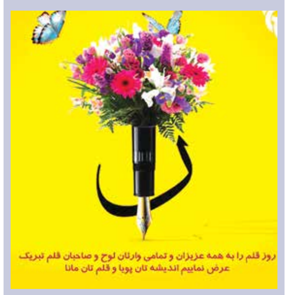
روز قلم را به همه عزیزان و تمامی وارثان لوح و صاحبان قلم تبریک عرض نمایم اندیشه تان پویا و قلم تان مانا