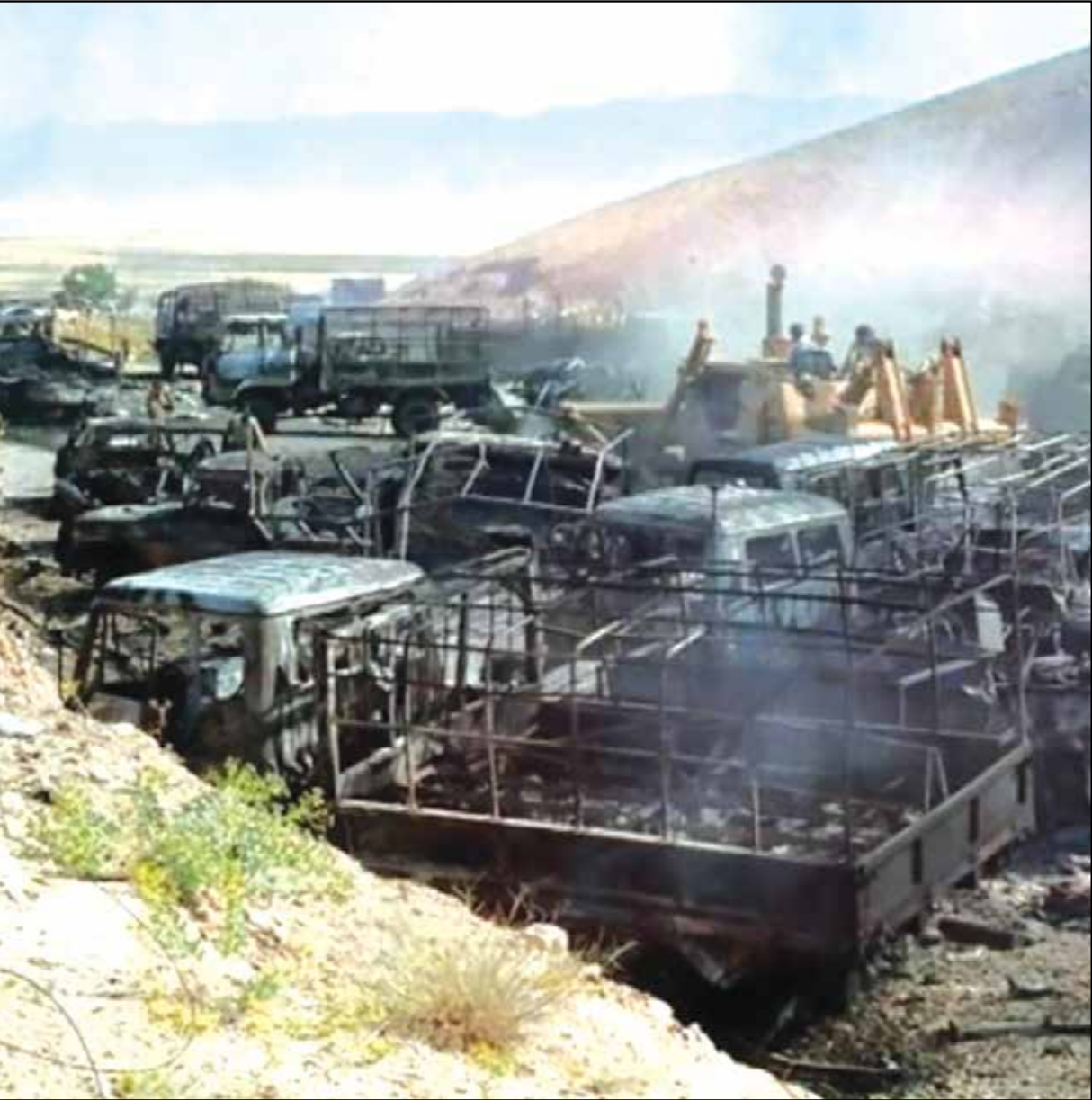
عکس نوشت: ساروز عملیات هرساک گرامی باد