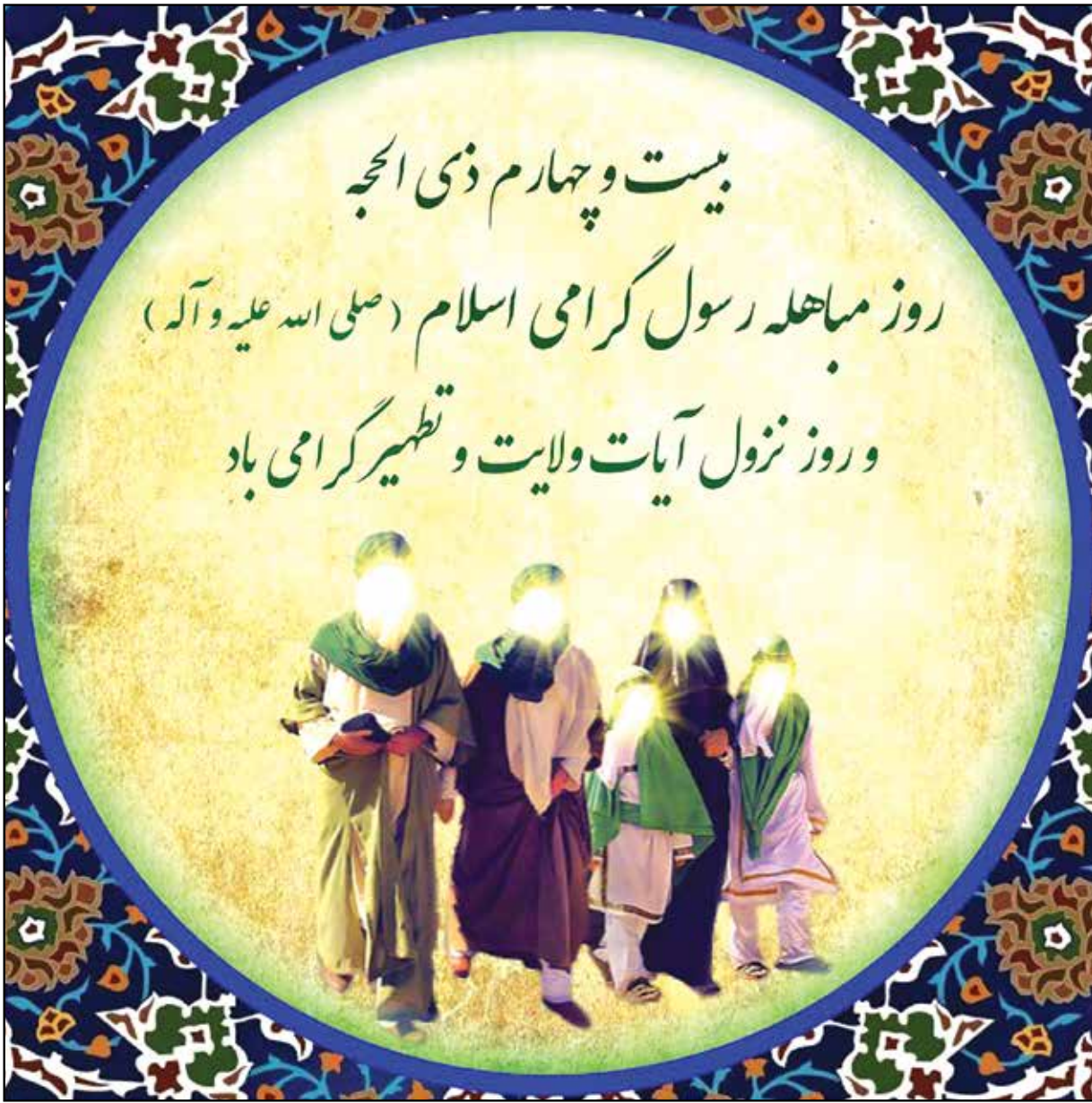
عکس نوشت روز مباحله رسول گرامی باد